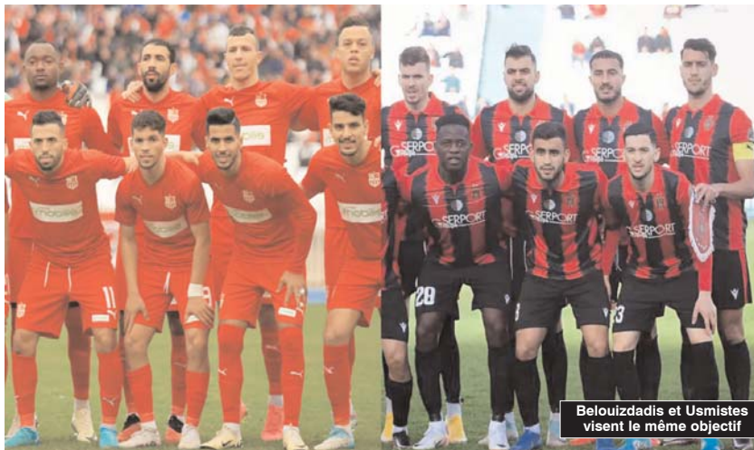
Belouizdad et Usmistes visent le même objectif

La demi-finale entre le CRB et l'USMA sera arbitrée par