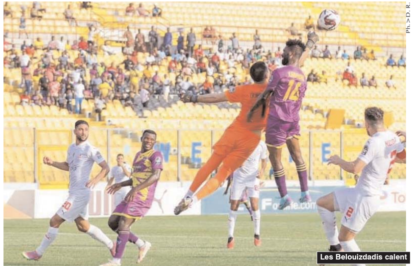
Les Belouizdadis calent

■ Le Chabab Riadhi de Belouizdad a raté le coche lors de la deuxième journée de la Ligue des champions d'Afrique, en s'inclinant (2-1) face au SC Medeama, en match disputé vendredi soir au stade Baba Yara Sports de Kumasi (Ghana).