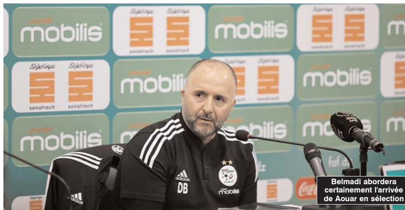
Belmadi abordera certainement l'arrivée de Aouar en sélection

■ Le sélectionneur national, Djamel Belmadi, tient une conférence de presse ce matin à partir de 11h au Centre des équipes nationales de Sidi Moussa, plus précisément à l'auditorium Omar-Kezzal.