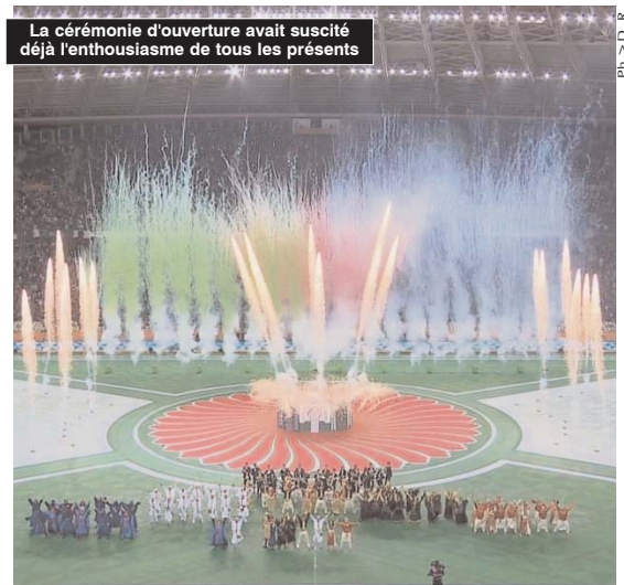
La cérémonie d'ouverture avait suscité déjà l'enthousiasme de tous les présents

Par ailleurs et toujours sur le plan de l'organisation de cet événement continental, les représentants des délégations africaines et d'instances du football ainsi que des visiteurs étrangers