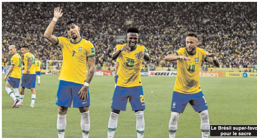
Le Brésil super-favori pour le sacre

■ Les deux équipes asiatiques, le Japon et la Corée du Sud, considérées comme des outsiders lors de ces huitièmes de finale de la Coupe du Monde 2022, seront en appel aujourd'hui face à des favoris en puissance pour la qualification au prochain tour, à savoir la Croatie et le Brésil.