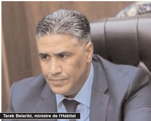
Tarek Belaribi, ministre de l'Habitat

refaits. Malheureusement, rien n'a été fait depuis ses déclarations. Avant-hier, au terme d'une réunion avec des cadres et responsables du secteur, consacrée à l'évaluation des projets AADL, le ministre de l'Habitat, Mohamed Tarek Belaribi, a annoncé la création de commissions ad hoc chargées de contrôler la qualité des logements AADL. En effet, dans une déclaration à la presse, Belaribi a indiqué avoir donné des instructions à la Direction générale et aux directeurs régionaux de l'Agence nationale pour l'amélioration et le développement du logement (AADL), pour la création de commissions ad hoc chargées de contrôler la qualité des logements, affirmant que son département ministériel aspire à distribuer «des logements de qualité». De son côté, le directeur général de l'AADL a appelé les directeurs régionaux à manifester plus de rigueur. Cela, notamment en matière de suivi des travaux ou encore en ce qui concerne le respect de la qualité des logements. Le même locuteur a, en outre, invité les autorités susvisées à soumettre leurs préoccupations, avant de les inciter à accélérer les travaux