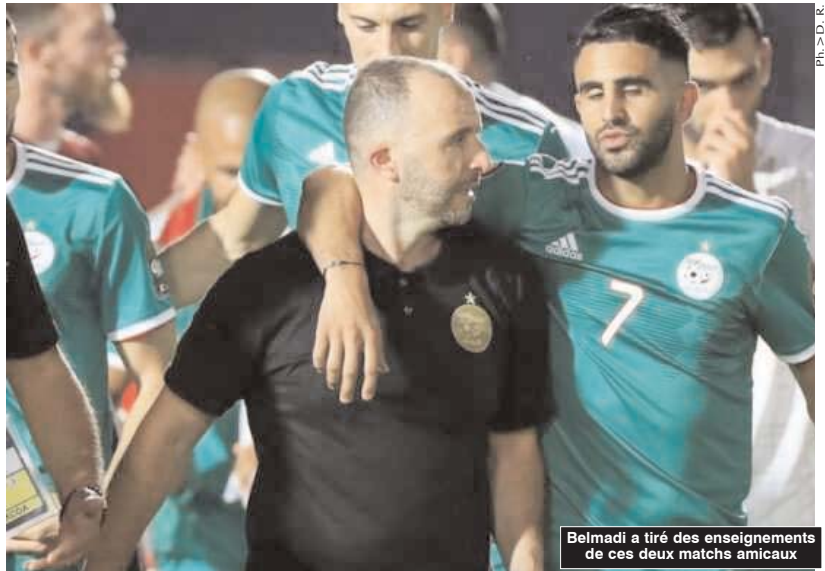
Belmadi a tiré des enseignements de ces deux matchs amicaux

■ La sélection algérienne de football a rassuré lors du match amical face au Nigeria, remporté sur le score de (2/1) au tout nouveau stade d'Oran.