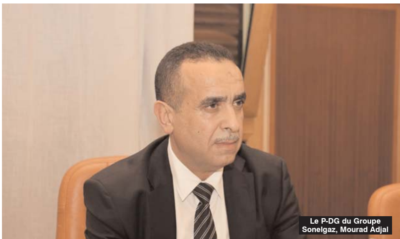
Le P-DG du Groupe Sonelgaz, Mourad Adjal

Concernant le raccordement des exploitations agricoles au réseau d'électricité, il a fait état de résultats positifs prévoyant le raccordement de 30 000 exploitations jusqu'à la fin de l'année 2022 et 48 000 exploitations agricoles en 2023. Il a également fait part de la programmation de 6 projets dans la wilaya de Biskra, relatifs à la réalisation de station