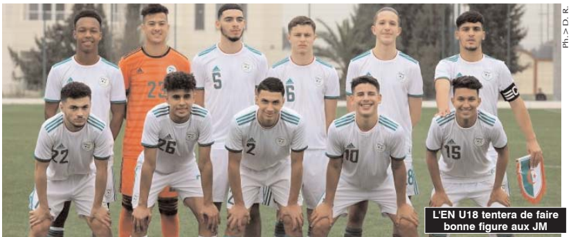
L'EN U18 tentera de faire bonne figure aux JM