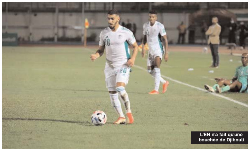
L'EN n'a fait qu'une bouchée de Djibouti

■ La sélection algérienne de football a facilement dominé son homologue djiboutienne (8-0, mi-temps 4-0), en match disputé jeudi soir au stade Mustapha-Tchaker de Blida, pour le compte de la première journée (Groupe A) des éliminatoires de la Coupe du monde 2022.