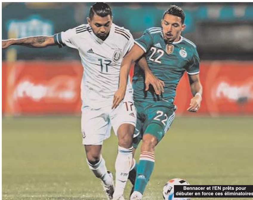
Bennacer et l'EN prêts pour débiter en force ces éliminatoires

■ L'équipe nationale algérienne de football débute ce soir (20h) sa campagne pour la qualification au Mondial 2022 du Qatar, en affrontant le Djibouti au stade Mustapha-Tchaker de Blida.