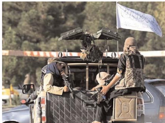
PH. A. D. R.

L'attentat de jeudi a poussé les talibans et Américains à collaborer plus étroitement. «Nous avons des listes données par les Américains (...) Si votre nom est sur la liste, vous pouvez passer»,