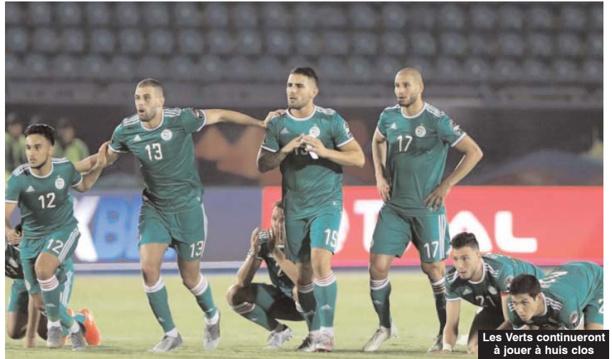
Les Verts continueront à jouer à huis clos