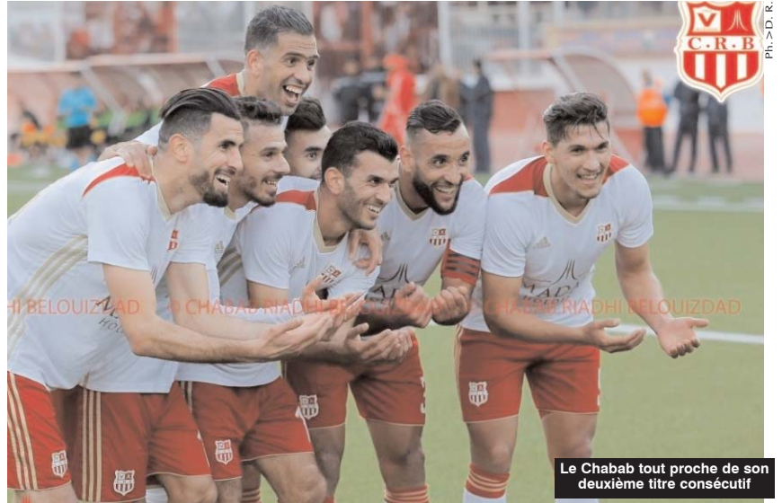
Le Chabab tout proche de son deuxième titre consécutif

■ Le champion sortant, le CR Belouizdad, sera aujourd'hui, lors de cette 37 e journée de la Ligue I, à 90' du huitième sacre de son histoire, avec son court déplacement chez le voisin l'USM Alger.