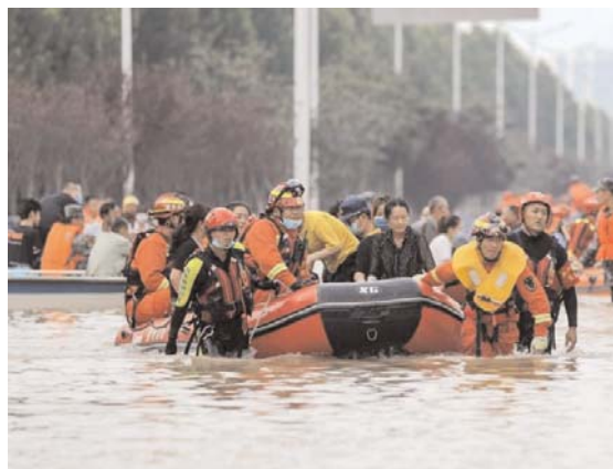
PH. > D. R.

sonnes âgées pour qui la situation reste difficile, car le niveau d'eau complique toute sortie.