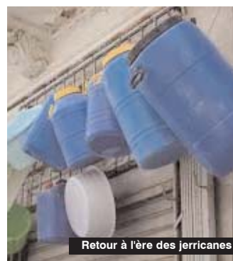
Retour à l'ère des jerricanes

L'absence de communication de la Seaal aggrave la situation. Les citoyens affirment que leurs appels au numéro vert de la cette société (1594) sont restés vains et ne passent pas tout simplement. Toutes leurs réclamations sont demeurées lettres mortes. Pis encore, sur la page de la société, les informations sur les coupures changent à chaque fois sans vraiment renseigner le citoyen sur les vraies raisons des coupures d'eau. C'est carrément le calvaire au quotidien, notamment pour certains quartiers de la capitale qui se sont retrouvés privés d'eau. Dans la commune de Gué de Constantine, à Ain Nadja, le manque d'eau agace le citoyen. Dans le nouveau plan de rationnement d'eau, il est prévu que cette commune sera alimentée quotidiennement de 8h à 16h, un jour sur deux. Ce programme n'est pas appliqué et les robinets sont restés à sec. Sur le site de la Seaal, la société explique d'abord les coupures par la baisse du niveau du réservoir (le fameux château d'eau) et que