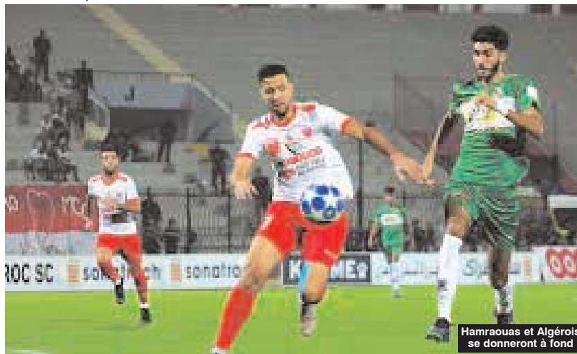
Hamraouas et Algérois se donneront à fond

■ La 26 e journée de la Ligue I de football sera marquée par le choc qui mettra aux prises, ce week-end, les deux Mouloudias, d'Oran et d'Alger, qui croiseront le fer ce samedi au stade Zabana d'Oran.