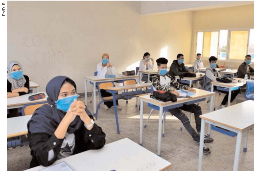
Par Thinhinene Khouchi

■ Selon l'Office national des examens et concours, «un total de 641 187 candidats est attendu demain aux épreuves du Brevet d'enseignement moyen pour la session de juin 2021, dont 625 223 candidats scolarisés (292 767 garçons et 332 456 filles) et 15 964 candidats indépendants».