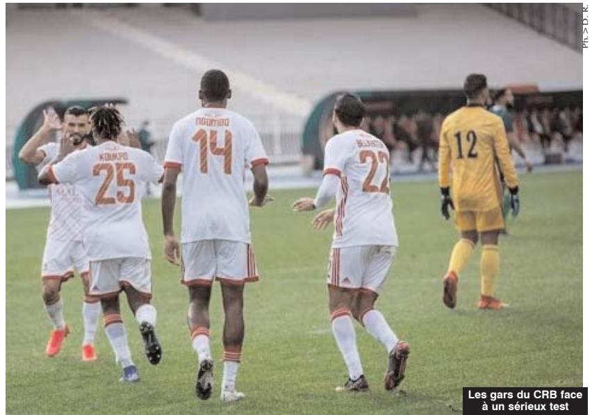
Les gars du CRB face à un sérieux test

Le Chabab Belouizdad tentera cet après-midi, au stade du 5-Juillet à Alger à partir de 17h, dans son match comptant pour les quarts de finale aller de la Ligue des champions d'Afrique, de prendre le dessus sur la redoutable formation tunisienne, l'ES Tunis, plusieurs fois championne d'Afrique, qui se déplacera à Alger en conquérant.