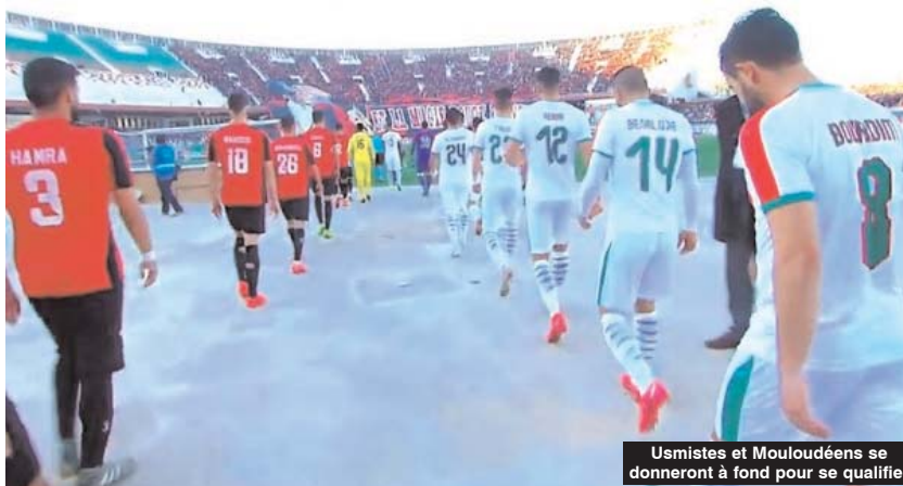
Usmistes et Mouloudéens se donneront à fond pour se qualifier

■ Le big derby algérois qui opposera l'USM Alger à son rival éternel le MC Alger, sera l'affiche de ces huitièmes de finale de la Coupe de la Ligue qui se jouent aujourd'hui.