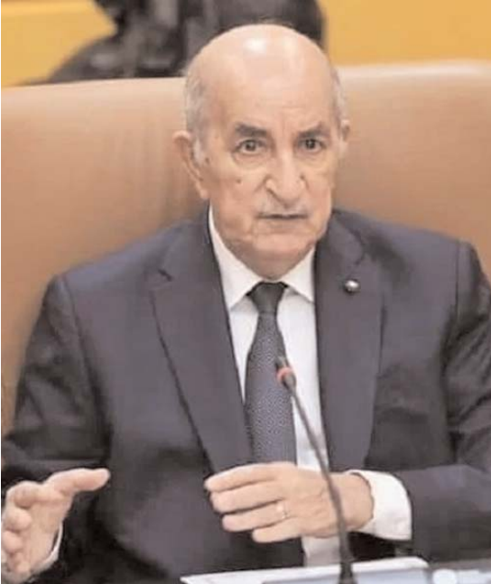
Par Aomar Fekrache

« C ette décision a été prise à la suite de l'engagement d'une opération d'importation par la compagnie