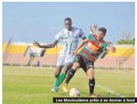
Les Mouloudéens prêts à se donner à fond