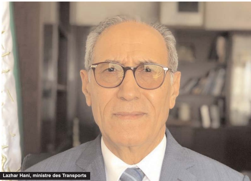
Lazhar Hani, ministre des Transports

Plusieurs mois après le déconfinement, certains moyens de transport restent toujours à l'arrêt, causant le mécontentement des usagers. Lors de son intervention, hier, au Forum de la Radio nationale, le ministre des Transports, Lazhar Hani, s'est exprimé sur la possibilité de la reprise des différents moyens de transport qui sont à l'arrêt depuis des mois en raison de la pandémie de Covid-19. Concernant la reprise des vols internationaux depuis et vers l'Algérie, question qui suscite beaucoup d'intérêt de la part des citoyens algériens, notamment ceux qui résident en dehors du pays, le ministre a assuré que «la décision de la réouverture des vols à l'internationale sera prise après la consultation du Comité scientifique chargé du suivi de l'évolution de l'épidémie de coronavirus», expliquant que «nous ne pouvons pas nous prononcer sur la question, du moment que la décision revient aux hautes autorités du pays et au Comité scientifique». Le ministre a tenu à préciser que la reprise des vols domestiques et l'opération de rapatriement, programmée pour ce mois en cours, se déroulent bien. «Les citoyens respectent le protocole sanitaire lors des vols domestiques et les vols destinés au rapatriement des Algériens et c'est bonne chose», a indiqué le ministre. S'exprimant sur les pertes engendrées par l'arrêt du