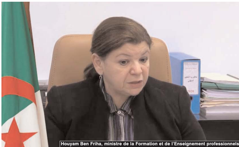
Houyam Ben Friha, ministre de la Formation et de l'Enseignement professionnels

Dans le cadre de la numérisation du secteur, la ministre a également fait part des inscriptions qui se sont déroulées sur la plateforme «Minhati» lancée au titre de la rentrée 2020-2021 au profit des candidats à la formation,