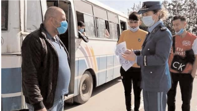
Ph.E. Soraya/J. A.