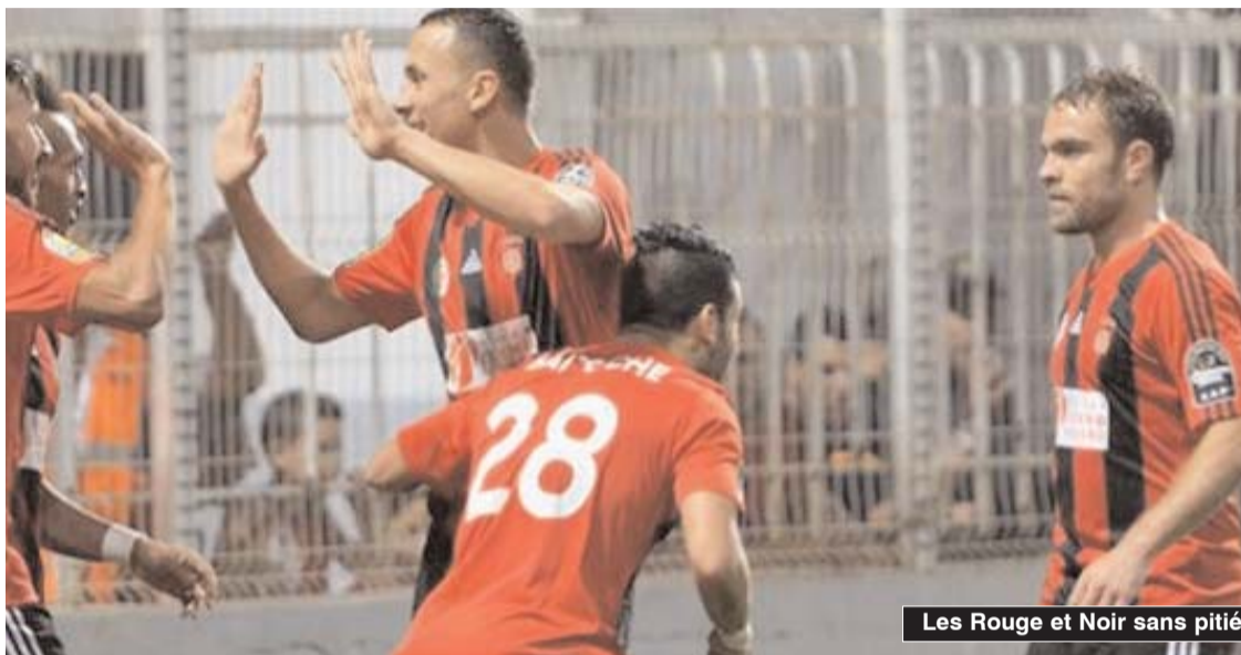
Les Rouge et Noir sans pitié

■ L'USM Alger, champion en titre, a pris seul la première place de la Ligue 1 Mobilis de football en atomisant le RC Relizane (6-0) en match disputé samedi soir au stade Omar-Hamadi pour le compte de la 2 e journée, au moment où l'USM El Harrach s'est fait surprendre par le MC Alger (2-1) au stade du 5-Juillet.