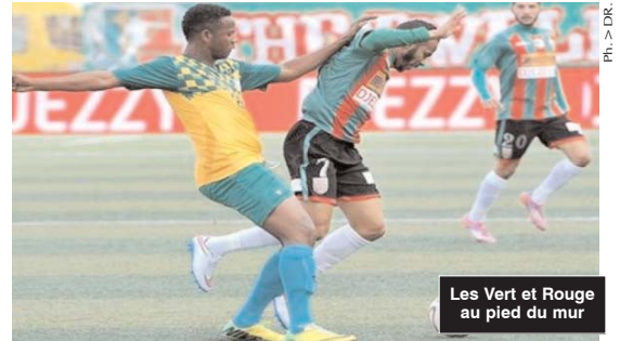
Les Vert et Rouge au pied du mur

■ Le MC Alger, tenu en échec à domicile par la formation du Sahel SC (0-0) lors de la manche aller du tour préliminaire de la Coupe de la Confédération de football, devra sortir le grand jeu à Niamey pour espérer rejoindre l'autre équipe algérienne, l'ASO Chlef, déjà qualifiée pour le second tour de la compétition.