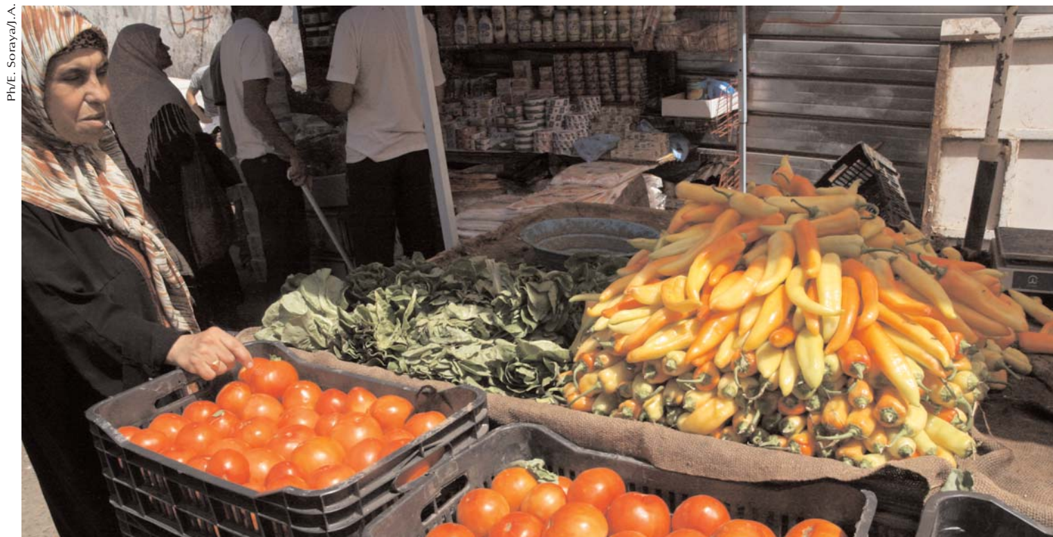
Par Magda Malek

■ A la fin de l'année 2014, et selon les données recueillies auprès du ministère du Commerce, les collectivités n'ont pu éradiquer que 872 marchés informels, laissant près de 500 autres encore en activité.