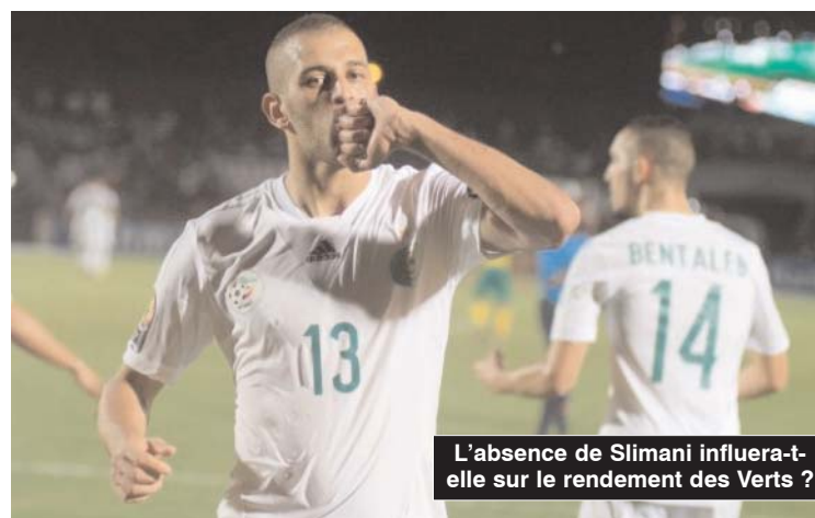
L'absence de Slimani influera-t-elle sur le rendement des Verts ?

La sélection nationale devait effectuer une séance d'entraînement sur le stade qui devrait abriter le match hier soir pour prendre ses