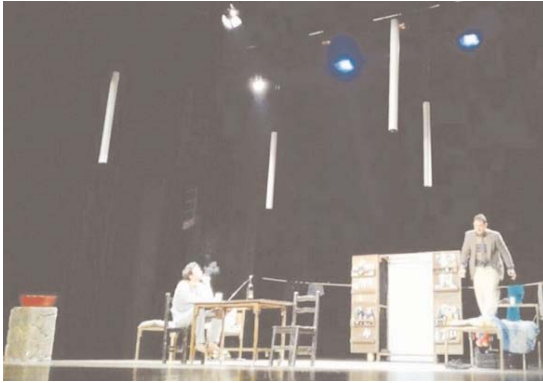
Par Adéla S.

A ccueilli au Théâtre national Mahieddine-Bachtarzi (TNA), le spectacle, programmé dans le cadre des Premières journées nationales du théâtre amazigh d'Alger, a été mis en scène par Sadek Youssi sur une adaptation du regretté Abdellah Mohia (Muhend U yahia) (1950-2004), tirée du texte, « Les Emigrés » du Polonais Sławomir Mrozek (1930-2013). Contraints à cohabiter dans une vieille cave d'un immeuble à Paris pour se partager le loyer, les deux antagonistes, que tout oppose, vont nourrir, 65 mn durant, un quiproquo inextricable, brillamment rendus par Yalah Mohand Ouidir dans le rôle de l'«intellectuel», et