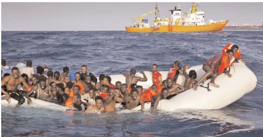
Par Louiza Ait Ramdane

■ Sur la persistance du phénomène des migrations amenant de nombreux jeunes du continent africain à quitter leur pays, le Croissant-Rouge algérien (CRA) met en cause l'intervention de l'OTAN en Libye qui a déstabilisé la région du Sahel, y provoquant la dissémination du terrorisme et l'exode des populations.