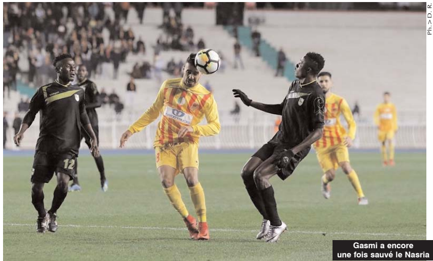
Gasmi a encore une fois sauvé le Nasria

■ Le Nasr d'Hussein-Dey a arraché sa qualification aux seizièmes de finales-bis de la Coupe de la Confédération africaine en battant, sur le fil, la formation zambienne de Green Eagles sur le score de (2/1), avant-hier soir au stade du 5-Juillet.