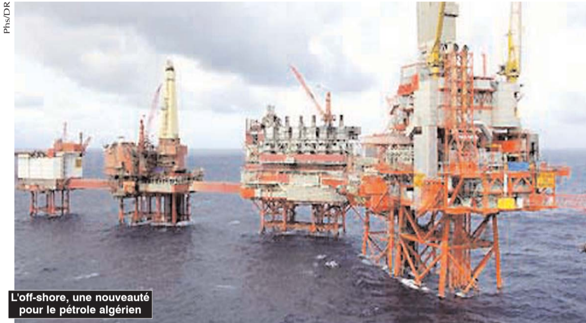
L'off-shore, une nouveauté pour le pétrole algérien

■ Le lancement d'un appel d'offres, le premier dans le cadre de la nouvelle loi sur les hydrocarbures, et l'aval pour l'exploitation du schiste ont été les principaux faits du secteur énergétique en 2014 sur fond d'une dégringolade des cours mondiaux du brut.