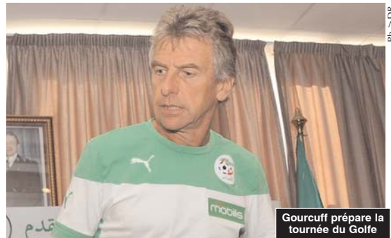
Gourcuff prépare la tournée du Golfe

Ce stage, et même si certains ne voient pas son opportunité étant donné que l'EN A' est sanctionnée par la CAF et ne prendra pas part au CHAN, devrait permettre au coach national, Christian Gourcuff, d'avoir une idée claire sur tous les joueurs du cru pour ensuite décider de leur convocation en non en équipe nationale première. Les meilleurs joueurs du championnat de Ligue 1 du moment devraient être au rendez-vous pour ce rendez-vous très important aux yeux du driver de l'EN qui pense que tout le monde doit être prêt pour ce stage surtout qu'il sera ponctué par un match amical face à la sélection des U 23 ans au stade Tahaker de Blida. Le coach de l'EN devait rentrer hier en Algérie après avoir été avant-hier en Belgique pour superviser un