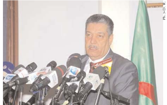
Ph. &gt; D. R.

Dans ce contexte, le ministre a fait état de la mobilisation d'unités médicales mobiles, dont une dizaine pour la wilaya de Ouargla, encadrées par un staff médical et paramédical, devant assurer des consultations et soins médicaux, déterminer la prévalence des maladies dans les régions enclavées, à l'appui de campagnes préalables de sensibilisation en direction des citoyens. Après avoir écouté les doléances formulées par les citoyens de la région de Rhourd El-Baguel (commune d'El-Borma), M. Boudiaf a souligné la nécessité de l'affectation d'un nombre suffisant d'ambulances