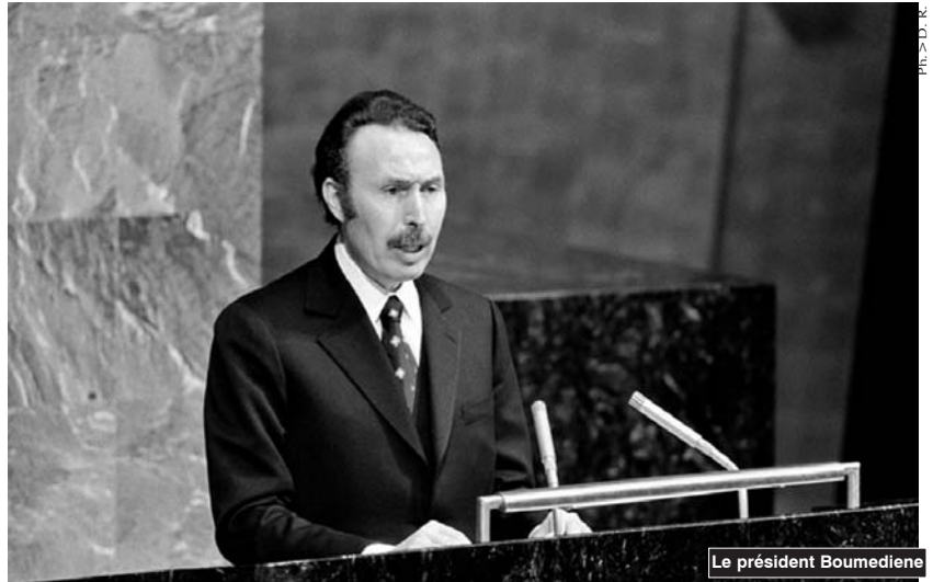
Le président Boumediène

refus revenait sur la question d'accorder à l'Algérie une majorité dans le capital des sociétés concessionnaires françaises et sur une révision à la hausse du prix fiscal.