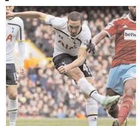
nouveau promu, reste lanterne rouge avec 18 points seulement.

tégralité de la rencontre, dans son rôle habituel de milieu récupérateur. A l'issue de ce match nul, Tottenham se hisse provisoirement à la 6 e place au classement avec 44 points, alors que West Ham pointe à la 8 e position (39 pts). L'autre international algérien évoluant en Premier league, Ryad Mahrez, a vu son équipe, Leicester City, revenir avec le point du match nul attaché sur le terrain d'Everton (2-2). Le joueur algérien, titularisé, a cédé sa place à la 62 e minute à son coéquipier David Nugent. Leicester,