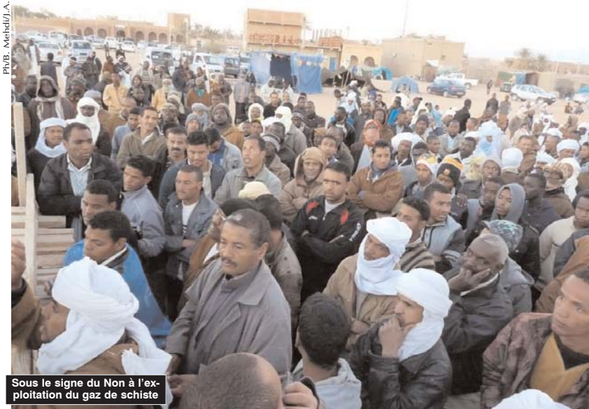
Sous le signe du Non à l'exploitation du gaz de schiste

■ La célébration de la journée du 24 février n'a jamais été aussi médiatisée et polémique que cette année, ce n'est pas parce qu'il s'agit d'une date historique mais c'est le contexte dans lequel elle intervient qui lui donne un nouveau cachet.