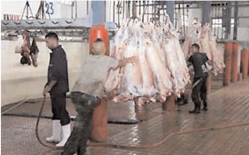
Par Maya T.

■ Ce recul se justifie par la demande croissante de la viande congelée importée mais aussi par le faible pouvoir d'achat du citoyen, les prix des viandes rouges (veau et mouton) étant généralement affichés à pas moins de 1 200 DA le kg.