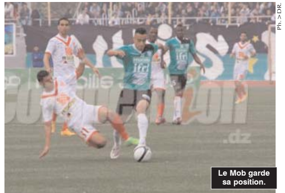
Le Mob garde sa position.

Le MO Béjaïa s'est emparé seul de la première place du championnat de Ligue 1 Mobilis de football malgré le nul concédé face au CR Belouizdad (2-2), profitant ainsi du faux-pas de l'ES Sétif, qui a été battue par le MC Alger (1-0) dans un match émaillé d'incidents qui ont poussé l'arbitre à arrêter la partie pendant 11 minutes, lors de la 23 e journée disputée ce week-end.