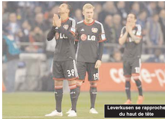
Leverkusen se rapproche du haut de tête

83) ont buté sur d'excellentes parades des deux gardiens. Évincé de la grande scène européenne mercredi par la Juve, Dortmund a profité d'un doublé d'Aubameyang et d'un adversaire réduit à dix pour renouer péniblement avec la victoire (3-2), samedi à Hanovre. Dortmund a mis fin à une série de quatre matchs sans succès et sans but pour consolider sa 10 e place (33 pts) et prendre une avance conséquente de 10 unités sur la zone rouge. «Il suffit de regarder le classement pour comprendre combien cette victoire est importante», soulignait le coach Jurgen Klopp, soulagé après le coup de sifflet final. Son équipe a dû en effet attendre l'expulsion de Bittencourt (55') pour briser l'égalité (1-1 à la pause) et faire