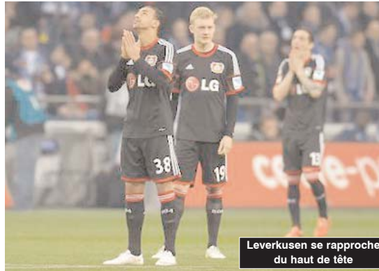
Leverkusen se rapproche du haut de tête