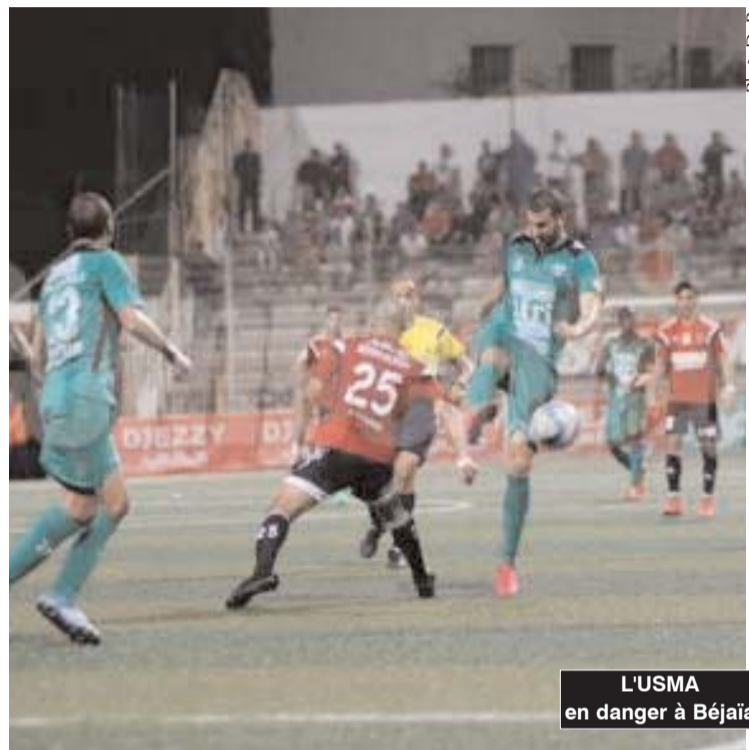
L'USMA en danger à Béjaïa