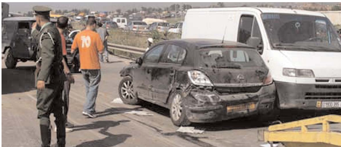
Par Louiza Ait Ramdane

■ Le mois de ramadhan de l'été 2015 a été marqué, hélas, encore une fois, par une hécatombe routière, qui a causé plus de 416 morts et plus de 3 356 blessés. Ce mois a été particulièrement sanglant sur les routes en Algérie.