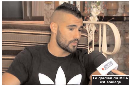
Le gardien du MCA est soulagé

Même s'il devait des mensualités au club et qu'il avait déposé son dossier au niveau de la commission des litiges, Matijas ne pouvait partir que si les issues du dialogue étaient fermées, hors le club de la Mekerra était disposé à trouver une solution et avait fait valoir ses droits surtout que le gardien avait signé à Mouloudia