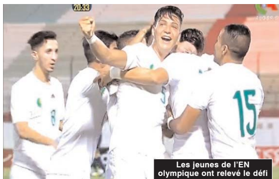
Les jeunes de l'EN olympique ont relevé le défi