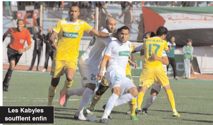
Les Kabyles soufflent enfin