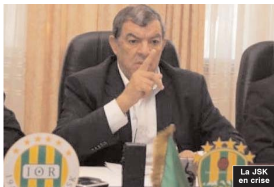
La JSK en crise

A insi, les éléments formant l'ossature de l'équipe de la saison dernière sans le sou, ce qui risque de provoquer une situation difficile, surtout avec les rumeurs faisant état de menaces de ces joueurs de boycotter la reprise des entraînements et même le stage que devrait programmer le staff technique et qui devrait se dérouler en Tunisie ou au Maroc. Ainsi, et au moment où tous les clubs ont bouclé leur recrutement et s'approprient à élaborer leur programme de préparation, c'est le silence radio à la JSK, sachant que les joueurs ne veulent pas entendre parler de reprise tant qu'ils n'ont pas touché leur dû. On croit savoir que les joueurs n'ont pas touché leurs salaires depuis au moins cinq mois, ce qui rend la situation très difficile pour le club. Il faut savoir que les