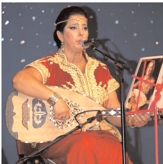
Par Abia Selles

Les programmes artistiques élaborés pour les veillées du ramadhan répondront aux différents goûts artistiques des Algérois. Ces derniers auront l'embarras du choix pour passer d'agréables moments musicaux. Après avoir dévoilé le programme artistique de l'établissement Arts et Culture, celui de l'hôtel Hilton d'Alger et du musée du Bardo, c'est au tour de l'hôtel El Aurassi, Dar Abdeltif et la salle El Mougar de proposer des menus artistiques riches et variés.