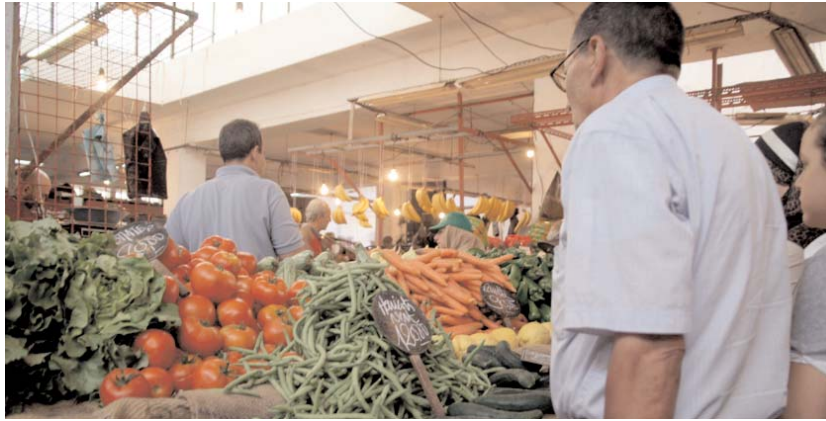
Par Meriem Benchaoua

■ Au deuxième jour, l'ambiance est toujours à la frénésie d'achat malgré la flambée. Les étals colorés et bien garnis affichant des prix élevés, en particulier pour les fruits de saison, n'empêchent pas les acheteurs de remplir leurs couffins en prévision du f'tour. Le citoyen courbe l'échine devant la dure loi implacable de l'offre et de la demande.