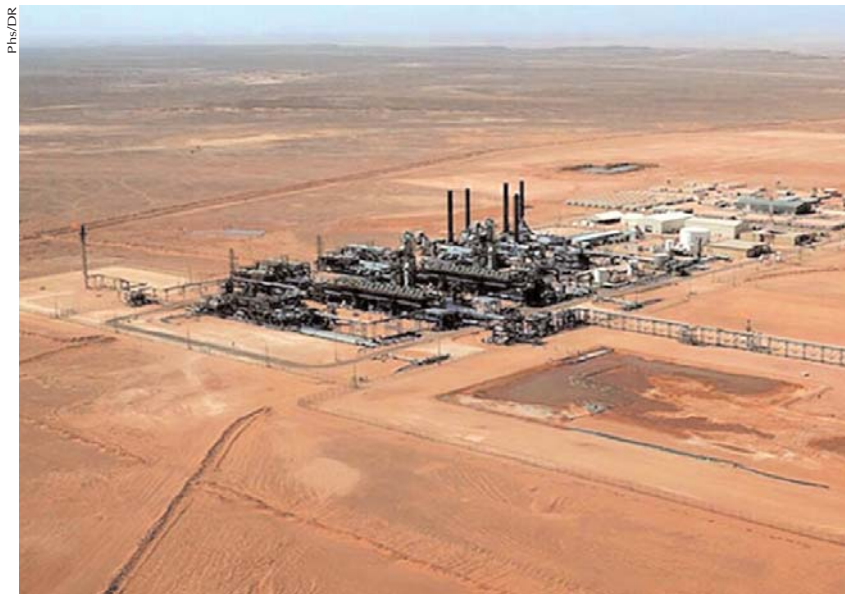
Par Souad H.

■ Un groupe de travail de l'Union internationale du gaz, réuni à Oran, a finalisé, hier, son rapport qui sera présenté lors du Congrès international du gaz prévu en juin prochain à Paris, selon l'Association algérienne de l'industrie du gaz.