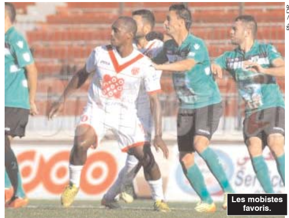
Les mobistes favoris.

De son côté, le dauphin, l'Entente de Sétif aura fort à faire en se déplaçant à Alger pour rencontrer le Mouloudia d'Alger qui souffre pour assurer son maintien en Ligue I. L'Aigle Noir risque d'être déplumé face au Doyen qui n'aura d'autre alternative que de l'emporter pour espérer garder un espoir, même infime, de rester dans la cour des grands. Les Vert et Rouge savent