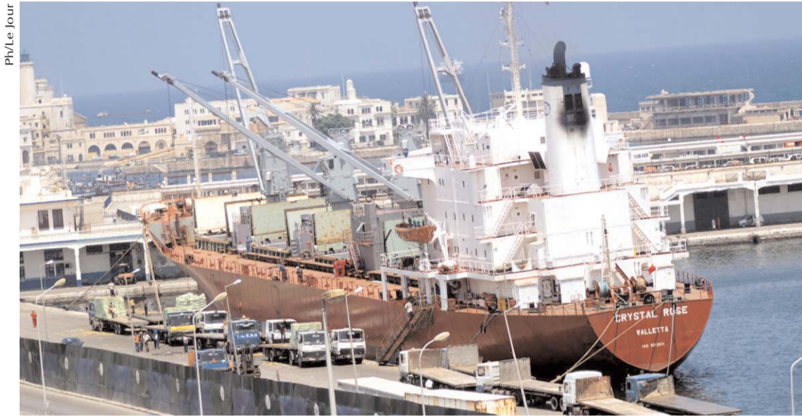
Par Tarek H.

■ La marchandise est saisie soit à titre provisoire en attendant la finalisation de la procédure administrative autorisant son écoulement sur le marché national, soit il est demandé à l'importateur de la retourner vers le pays d'origine car non conforme aux critères en vigueur, a-t-il précisé avant de souligner que, parfois, la destruction de la marchandise s'impose.