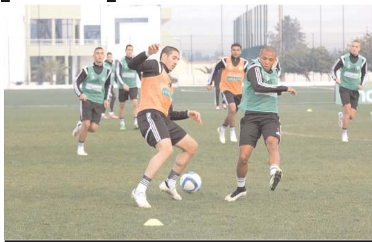
Les Verts seront une des attractions de cette CAN

Seule la Guinée équatoriale s'est dit disposée à l'organiser après les sollicitations de Hayatou qui a discuté avec le président de ce pays en personne. La CAF a prévenu tout le