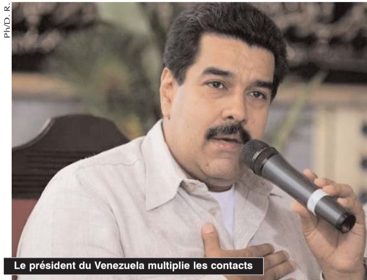
Le président du Venezuela multiplie les contacts

Même si le Venezuela abrite les plus importantes réserves de brut au monde, ses finances sont en piteux état car il dépend fortement de ses revenus pétroliers, qui apportent 96% de ses devises. D'où la tournée mondiale du président vénézuélien Nicolas Maduro qui l'a mené dans plusieurs pays membres de l'Opep, à savoir l'Iran, l'Arabie saoudite, le Qatar, la Russie et l'Algérie où il a effectué une visite de deux jours à l'invitation du Président Bouteflika. Le but de cette tournée est d'aboutir, en concertation avec les pays membres de l'Opep, à une remontée des prix du baril. En Russie, la chute vertigineuse depuis l'été des cours du pétrole, qui représente avec le gaz la majorité des revenus budgétaires du pays, a fait couler le rouble, déjà fragilisé par la crise ukrainienne et les sanctions européennes. L'Algérie et le Venezuela sont convenus à une plus grande coordination de leurs efforts pour réunir les conditions d'un assainissement de la situation du marché pétrolier face à la forte chute des cours du brut. Le président de la République, Abdelaziz Bouteflika, et son homologue vénézuélien, Nicolas Maduro, «sont convenus d'une coordination accrue des efforts des deux pays en vue de réunir les conditions d'un assainissement de la situation du marché pétrolier mondial et d'une rémunération adéquate des exportations de