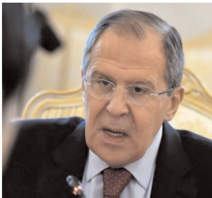
PH. D. R.

«Tous ceux qui, de près ou de loin, ont participé à ces violences, à ces combats de rue, doivent être non seulement iden-