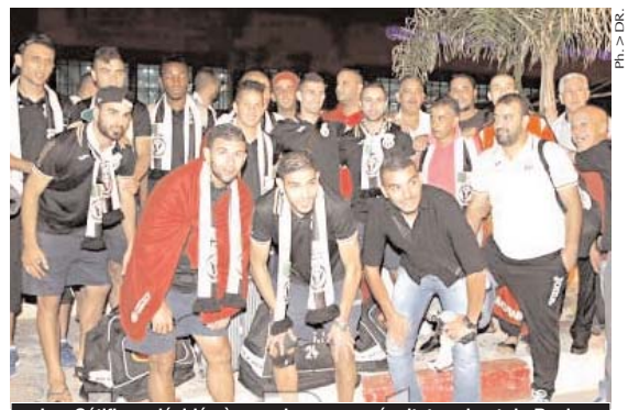
Les Sétifiens décidés à revenir avec un résultat probant de Banju