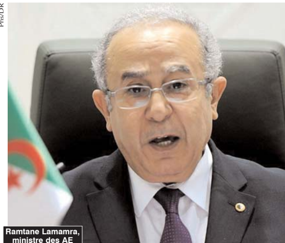
Ramtane Lamamra, ministre des AE

Dans une conférence de presse animée conjointement jeudi dernier avec son homologue tunisien, le chef de la diplomatie algérienne, a tenu à rappeler que l'Algérie avait été chargée, dans le cadre du grou-