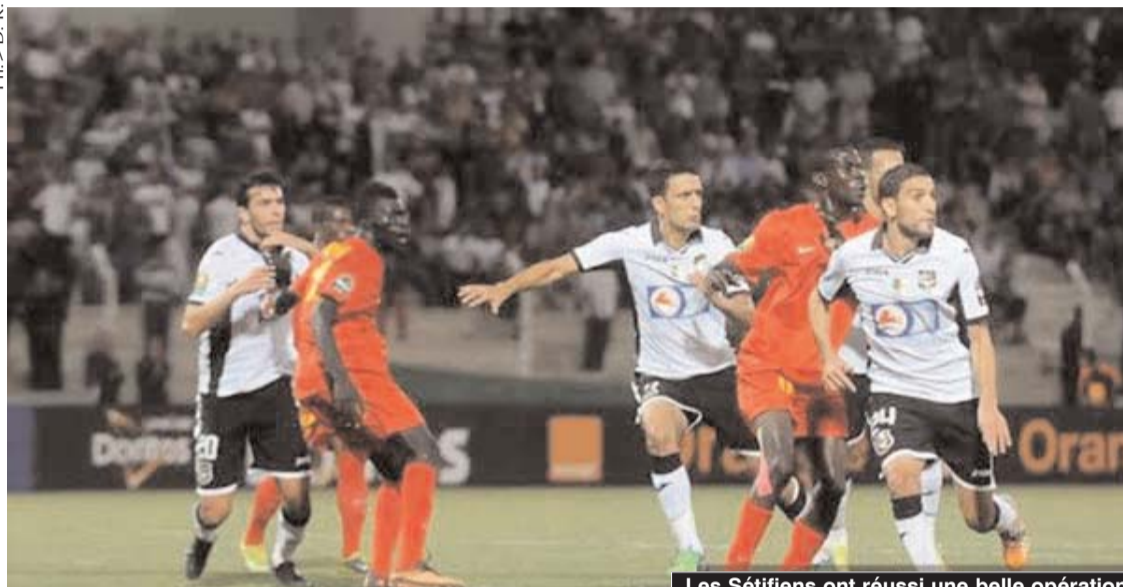
Les Sétifiens ont réussi une belle opération

Fortunes diverses pour nos représentants dans les deux compétitions africaines, la Ligue des champions et la Coupe de la Confédération, dans ces matchs comptant pour les huitièmes de finale de ces compétitions.