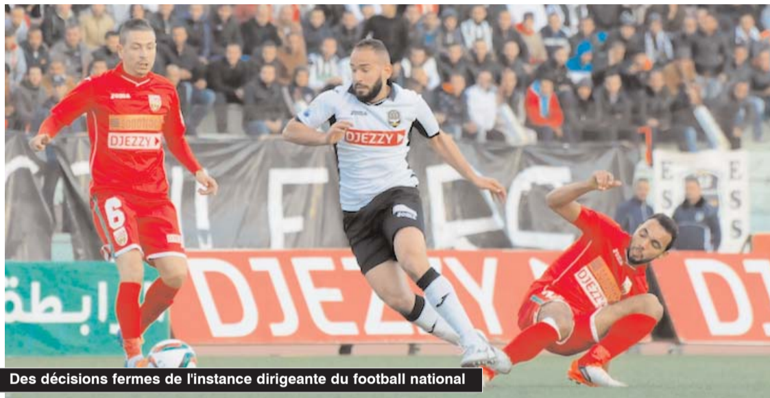
Des décisions fermes de l'instance dirigeante du football national

■ Les instances gérant le championnat professionnel se mobilisent pour tenter de bien gérer la fin de la Ligue I Mobilis, surtout que des rumeurs, comme à chaque fin de saison, circulent sur une probable magouille qui concernerait surtout les équipes qui jouent leur maintien en élite.