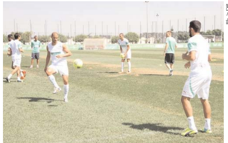
Les joueurs de l'EN doivent maintenant se concentrer sur le Mali

Tout cela fait qu'ils se devaient de prendre leur souffle surtout aussi qu'ils sont arrivés dimanche au petit