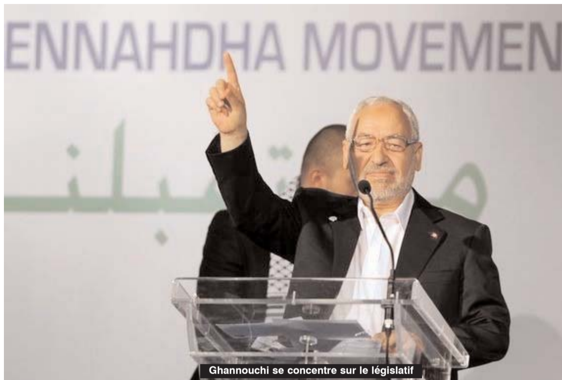
Ghannouchi se concentre sur le législatif

La Constitution tunisienne adoptée en début d'année prévoit un régime politique dominé par le Parlement et où le président n'a que des pouvoirs limités. Ennahdha et Nidaa Tounes favoris. Ennahdha, vainqueur d'élections en octobre 2011, et leurs détracteurs du parti Nidaa Tounes sont, selon des observateurs, les favoris des prochaines élections. L'instance chargée d'organiser ce scrutin crucial pour la stabilité de la Tunisie a enregistré l'inscription de plus de 1 500 listes électorales totalisant quelque 15 000 candidats aux législatives. Les prochaines élections doivent