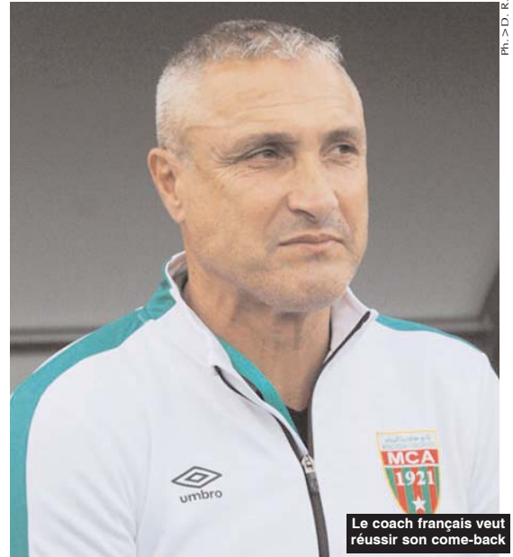
Le coach français veut réussir son come-back