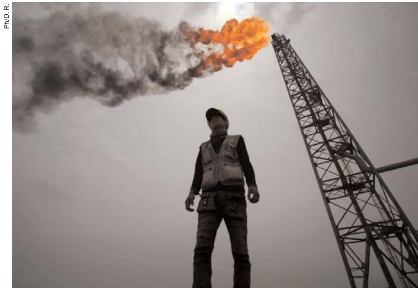
Par Salem K.

■ Le prix du panier de quatorze pétroles bruts, qui sert de référence à l'Organisation des pays exportateurs de pétrole (Opep), a augmenté à 70,45 dollars le baril mardi, contre 70,23 dollars la veille (lundi), a indiqué hier l'Organisation pétrolière sur son site web.