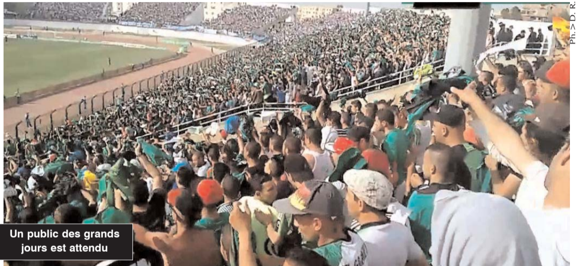
Un public des grands jours est attendu

■ Tous les billets ayant été mis en vente pour ce match qui se joue dimanche face au Cameroun pour le compte de la première journée du troisième et dernier tour des éliminatoires du Mondial 2018 de Russie ont été écoulés et de ce fait ce premier match des Verts se jouera à guichets fermés.