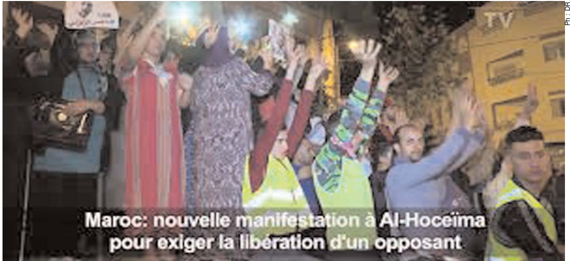
Maroc: nouvelle manifestation à Al-Hoceïma pour exiger la libération d'un opposant