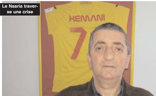
Le Nasria traverse une crise