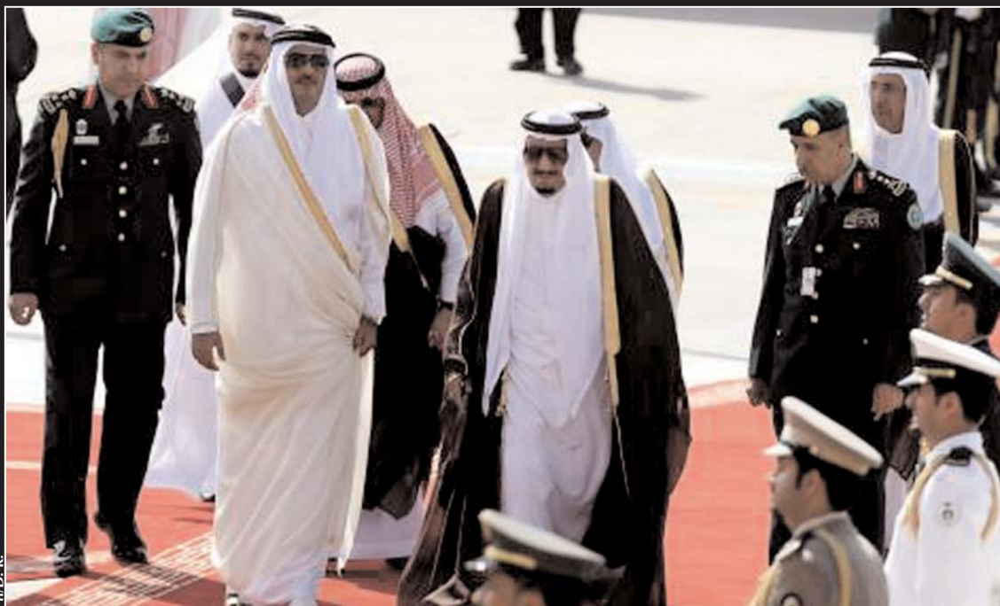
Le Qatar a vu lundi l'Arabie saoudite, Bahreïn, les Emirats arabes unis, le Yémen, l'Egypte et les Maldives rompre toute relation diplomatique entretenue avec ces Etats. Lire page 2

Ouverture d'un faux compte twitter Guitouni condamne fermement l'usurpation de son identité