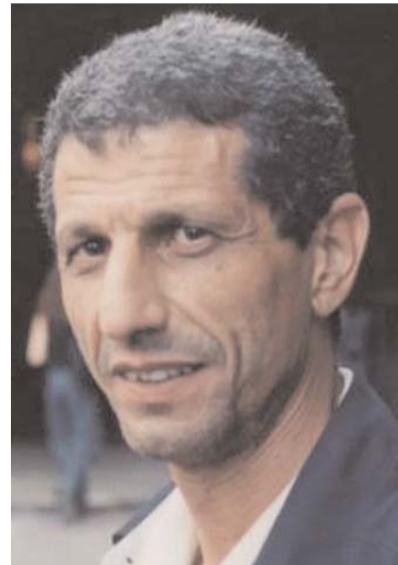
algérien – revendiqué par le groupe «Aouchem» à la fin des années 1960 – à travers quatre