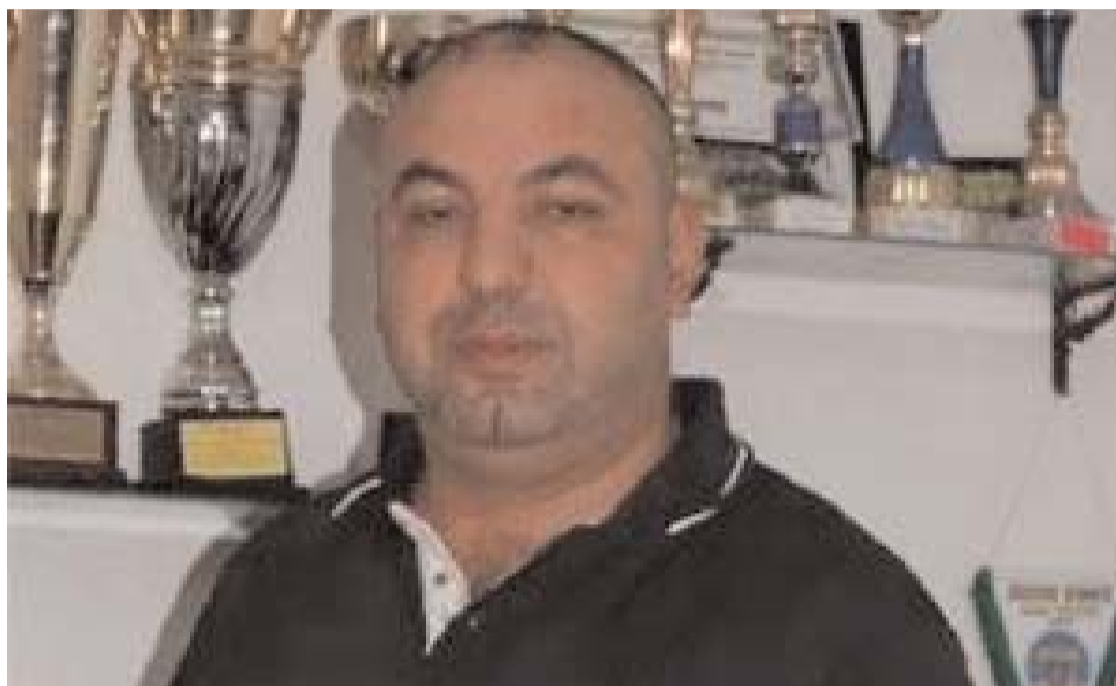
Ph. &gt; D. R.

accordée vendredi à radio Soummam, le nouveau président des «Crabes» a affirmé qu'il avait trouvé un accord avec les Mebarakou, Rahmani et Benali pour poursuivre leur aventure avec le MOB. De son côté, l'attaquant Okacha Hamzaoui, très convoité sur le marché des transferts, devrait rencontrer dimanche Attia pour tenter de trouver un accord. Outre les Youngs Africains, le MOB jouera également aux côtés du TP Mazembe (RD Congo) et Medeama (Ghana). Les Béjaouis ont été reversés en Coupe de la Confédération après leur élimination en 1/8 e de finale de la Ligue des champions. Le MOB a terminé la saison 2015-2016 à la 5 e place au classement final avec 44 points en compagnie de l'ESS. R. S.