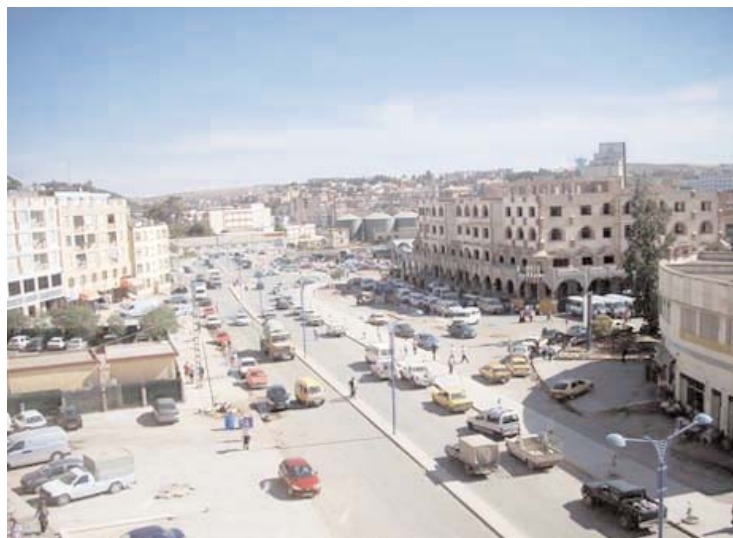
PH. D. R.

qui a provoqué une certaine anarchie dans ce secteur au niveau local. «Plusieurs régions enclavées sont desservies par le transport anarchique et illicite», a noté la commission dans son rapport remis aux autorités locales de la wilaya. L'élaboration de nouveaux plans de transport et de circulation est indispensable pour la wilaya de Bouira. Ces futurs plans doivent être adaptés aux nouvelles mutations qu'a connues Bouira ces dernières années, a estimé la commission dans son document présenté mercredi et jeudi devant l'APW. Dans ce cadre, la même commission a déploré entre autres l'absence de contrôle sur les transporteurs, ainsi que sur les horaires et sur la surcharge des bus, avant de soulever par ailleurs la dégradation des routes et la vétusté des bus de transport scolaire. «Les routes doivent être réhabilitées et de nouveaux bus doivent être achetés pour assurer une bonne prise en charge pour les enfants scola-