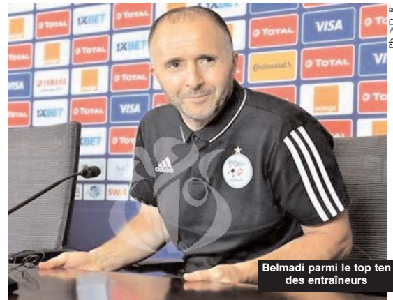
Belmadi parmi le top ten des entraîneurs

Belmadi (43 ans) figure sur une liste qui comprend neuf autres entraîneurs. Il s'agit de Didier Deschamps (équipe de France), Marcello Gallardo (River Plate/ Argentine), Ricardo Gareca (équipe du Pérou), Pep Guardiola (Manchester City), Jurgen Klopp (Liverpool), Mauricio Pochettino (Tottenham), Fernando Santos (équipe du Portugal), Erik Ten Hag (Ajax Amsterdam) et Tite (équipe du Brésil). Un panel d'experts du