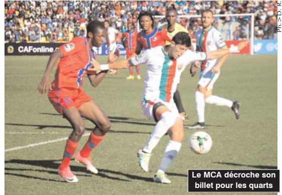
Le MCA décroche son billet pour les quarts

En effet, les gars de Soustara se sont neutralisés avec la formation du Ahly de Tripoli de Libye sur le score de (1/1), alors que le Mouloudia d'Alger a battu l'équipe sud-africaine de Platinum Stars sur le score de (2-0), vendredi soir. Les Rouge et Noir s'étaient déplacés à Tunis pour y affronter les Libyens qui reçoivent à Sousse, en raison des troubles dans leur pays, et ont réussi à revenir avec un résultat probant lors de cette cinquième journée de la Ligue des champions d'Afrique. Le défenseur central Farouk Chafai a ouvert le score dès la 16 e minute de jeu, profitant d'une mauvaise appréciation du portier libyen. Les joueurs de l'entraîneur égyptien Talaat Youssef ont réussi à remettre les pendules à l'heure juste avant la mi-temps par l'entremise de Anis Saltou (38 e ). Au début de la seconde période, les Libyens ont bénéficié d'un penalty (48 e ), arrêté par le gardien de but de l'USMA Mohamed Lamine Zemmamouche. A l'issue de ce résultat, USMA et Ahly Tripoli totalisent chacun 8 points, à trois longueurs d'avance sur le