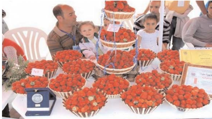
PH &gt; D. R.

Le musée Kotama qui a abrité cette manifestation a regroupé, pour cette 11 e édition, les producteurs de plusieurs localités de la région ainsi que des pâtisseries excellent dans l'art de confectionner des gâteaux et des tartes à base de ce fruit rouge charnu. En constante évolution depuis son lancement en 2002, sur seulement quatre hectares «à titre expérimental», la culture de la fraise se pratique aujourd'hui sur plus de 322 hectares, pour une production, au terme de la campagne 2014-2015, de près de 97 000 quintaux. Une production qui n'avait pas excédé les 80 000 quintaux en 2013-2014, contre 52 450 quintaux en 2012-2013, ce qui dénote de l'évolution régulière de la production, ont souligné des responsables des services agricoles. Le nombre de producteurs, exerçant notamment dans les communes côtières de Sidi-Abdelaziz, Oued Adjoul, El Kennar, Beni Hebib, Chekfa, El Aouana, El Ancer, Taher, Emir-Abdelkader, Kaous et Jijel, est passé, quant à lui, de 171 en 2002 à 555 cette année. La qualité des sols «explique en grande partie la réussite de cette spéculation où l'élément féminin prédo-